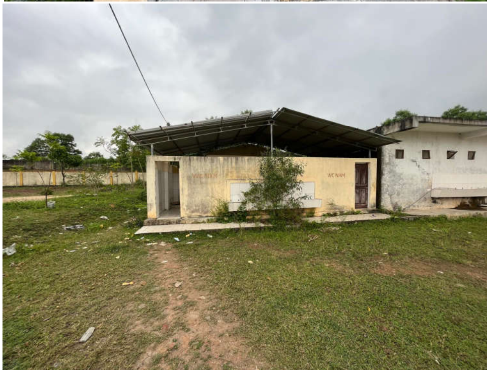
Rất nhiều vỏ bao thuốc lá trước nhà vệ sinh đã xuống cấp