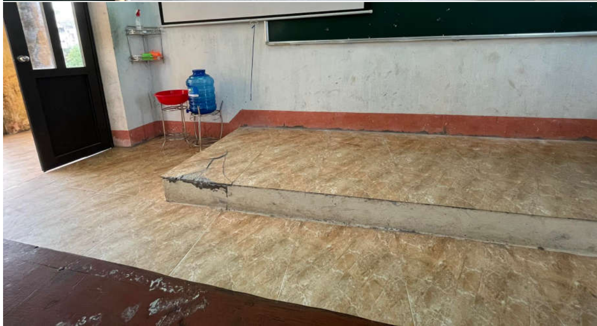
Cơ sở vật chất xuống cấp