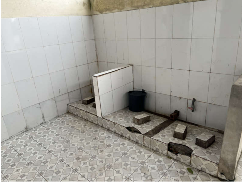
Nhà vệ sinh xuống cấp nghiêm trọng, đây rây bao thuốc lá cả trong và ngoài, trước cửa nhà vệ sinh