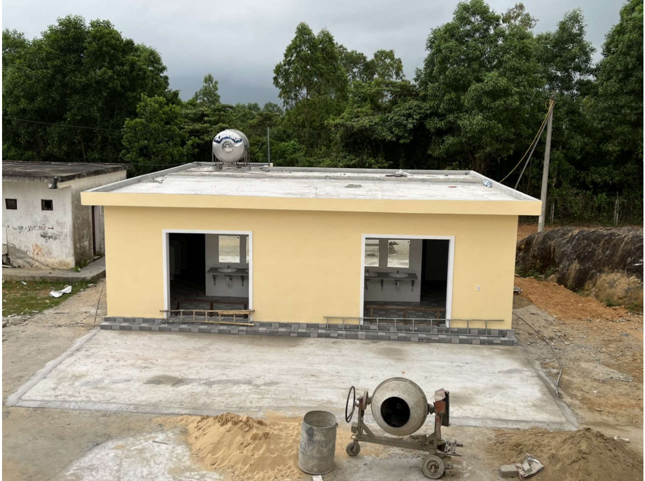
Nhà vệ sinh có giá gần 1 tỉ chưa hoạt động