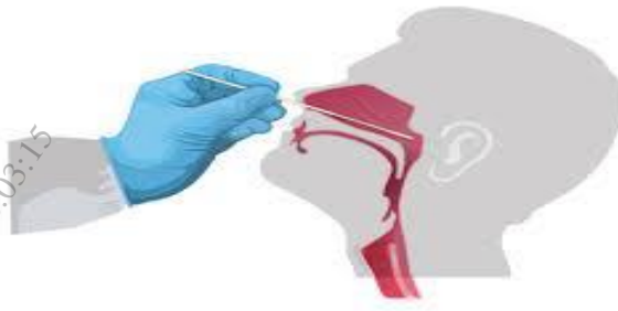
Hình 1: Lấy mẫu ngoáy dịch ty hầu